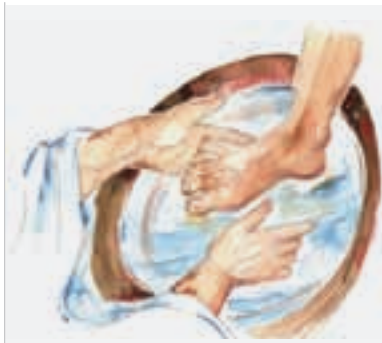
Ilustração: Glair Arruda

Ao longo de sua história, a Igreja Batista de Água Branca tem reafirmado que, ao ser a comunidade do Cristo, o Filho do Deus Vivo, quer ser lugar de compaixão, solidariedade e prática da justiça. Jesus de Nazaré, apresentado pelo apóstolo